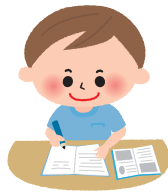
がっこう 学校が始まる