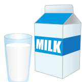
牛乳(ぎゅうにゅう)