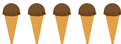
いち に さん し ご