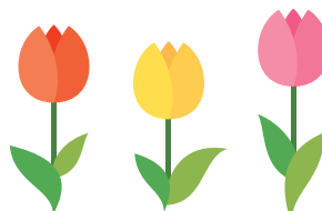
いち に さん